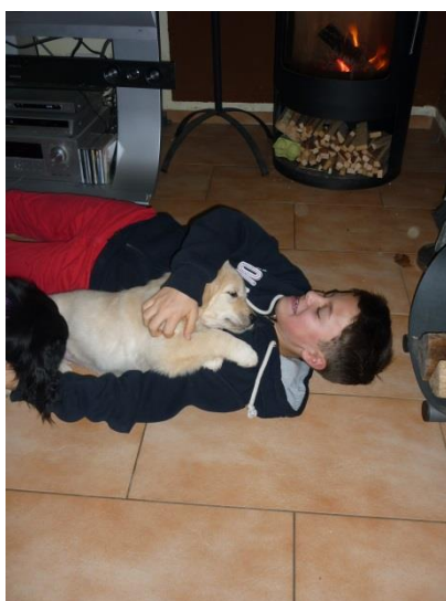
Bindung zu Zwei- und...