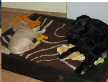
... Vierbeinern der Familie.