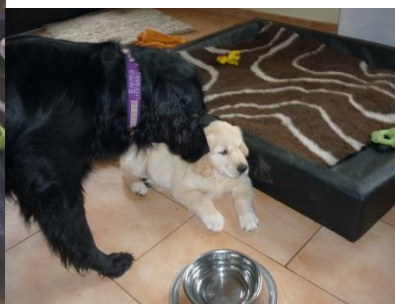
... eigentlich vollkommen unnötig