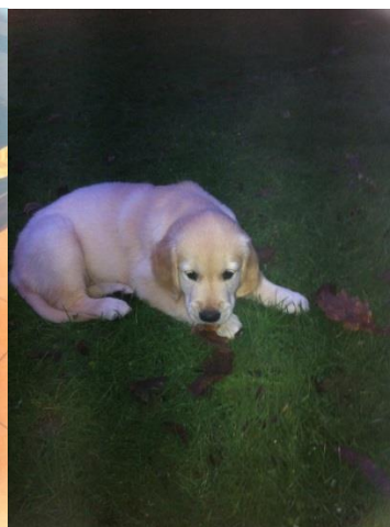
Draußen Geschäfte verrichten...