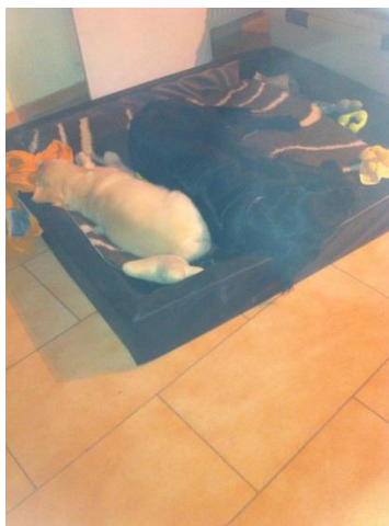
Nochmal Schlafplätze sichern....