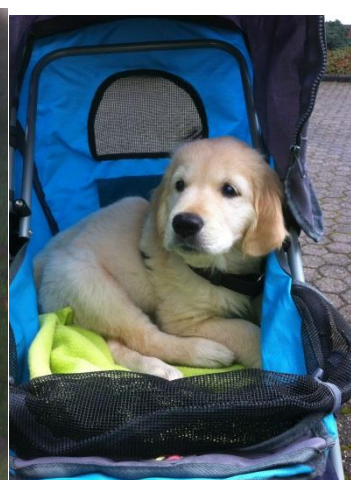
Kinderwagen fahren, damit ich auch bei Emma Gassi mit kann (-;

Sie macht alles super und verblüfft uns, durch ihr ruhiges, ausgeglichenes, aber auch spielfreudiges Wesen.