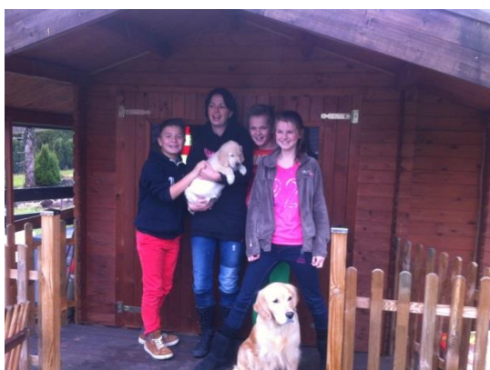
Das Abschiedsbild für die HP