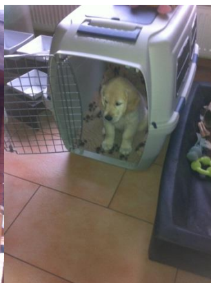
Erst mal sichere Höhle